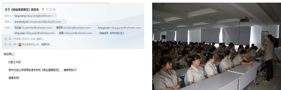
图表 3：公司践行诚信守法教育活动示例

公司还结合各相关方的利益需求，采用自查、社会公众及其他相关方监督、第三方测量相结合的方法，量化绩效指标，全面评价并促进组织内部及与顾客、供方和合作伙伴之间、公司治理中的诚信和道德行为，确保合同双方权益不受损害等。